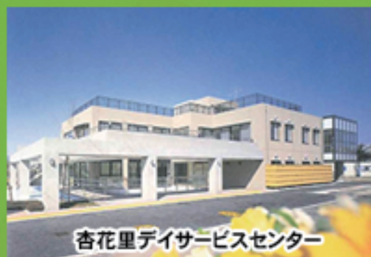
杏花里デイサービスセンター