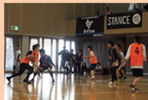
バスケットボール、バドミントン他