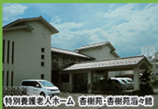
特別養護老人ホーム 杏樹苑・杏樹苑滔々館