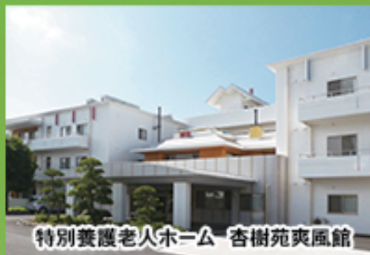
特別養護老人ホーム 杏樹苑爽風館

老人福祉介護事業では、特別養護老人ホーム杏樹苑、杏樹苑滔々館、杏樹苑爽風館、杏花里デイサービスセンター、入間市西武地区地域包括支援センター、入間市東藤沢地域包括支援センター等を運営しています。